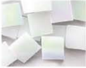
ホワイトオーロラ 10-2955 約25g入り