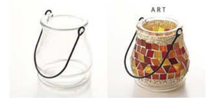
10-3115 ガラスベース ランタン size 底直径：7.5cm×高さ：9.5cm