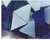
ブルー系 MIX 10-2963