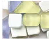
パステル MIX 10-2980