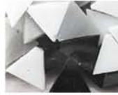
モノトーン MIX 10-2965