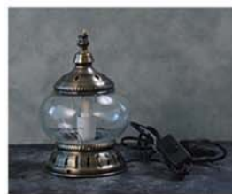
10-3395 モザイクガラスランプ A size 全体：直径約 11.5cm×高さ 20cm ガラス部分：高さ約 8.5cm×幅 12.5cm