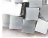
モノトーン MIX 10-2959 約50g入り