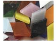
マルチ MIX 10-2975