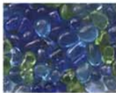
ブルーグリーン系 MIX 10-2982