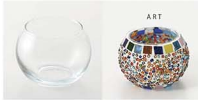
10-2990 ガラスベース丸1 size 底直径：4cm×高さ：6cm 中間の幅：8cm

ガラスのケースです。 透明なガラスを貼り付けて、キャンドル（LED ライト）ホルダーとして使うのがおすすめ。