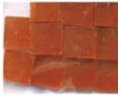
透明オレンジ 10-2949 約25g入り