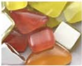
レッドイエロー系 MIX 10-2976