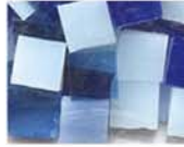
ブルー系 MIX 10-2957 約50g入り