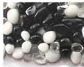
モノトーン MIX 10-2983