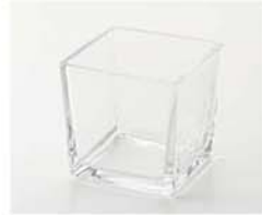
10-2991 ガラスベース 四角 size 底縦：7.5cm×底横：7.5cm 高さ：8cm