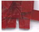
透明レッド 10-2950 約25g入り