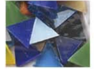
マルチ MIX 10-2968