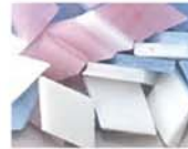
パステル MIX 10-2974