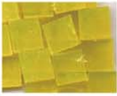
透明イエロー 10-2948 約25g入り