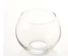
10-3114 ガラスベース 丸2 size 底直径：5cm×高さ：8cm 中間の幅：10cm