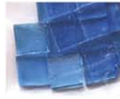
透明ブルー 10-2952 約25g入り