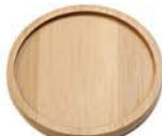
10-3401 竹製コースター 丸 size 9.5×9.5×1.1cm