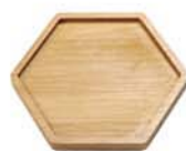
10-3402 竹製コースター 六角形 size 12.5×12.5×1.1cm