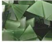
グリーン系 MIX 10-2964