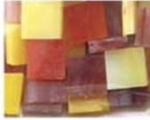
レッドイエロー系 MIX 10-2956 約50g入り