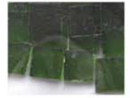
透明グリーン 10-2954 約25g入り