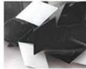
モノトーン MIX 10-2972