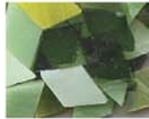
グリーン系 MIX 10-2971