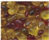
レッドイエロー系 MIX 10-2981