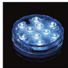
10-3117 LED ライト size 直径：7cm 作品を上に乗せて使用します。 リモコンで好きなカラーに変えられます。