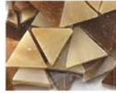
ブラウン系 MIX 10-2966