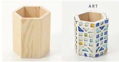
10-2988 ウッドベース 六角 size 縦：9cm×横：8cm×高さ：10cm