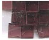
透明アメジスト 10-2951 約25g入り