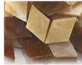
ブラウン系 MIX 10-2973