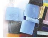
マルチ MIX 10-2960 約50g入り