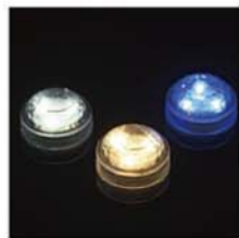
10-3116 LED ミニライト size 直径：2.5cm 7色にグラデーションで光ります。 作品の中に入れてキャンドルの替わりに。