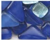
ブルー系 MIX 10-2977