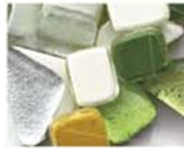
グリーン系 MIX 10-2978