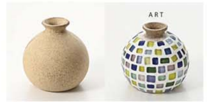
10-2989 ウッドベース 瓶 size 底直径：5cm×高さ：9cm 中間の幅：9cm