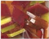
レッドイエロー系 MIX 10-2969