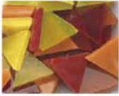
レッドイエロー系 MIX 10-2962