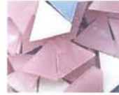
パステル MIX 10-2967