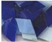
ブルー系 MIX 10-2970