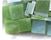
グリーン系 MIX 10-2958 約50g入り