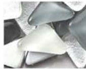
モノトーン MIX 10-2979