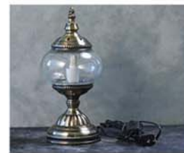
10-3396 モザイクガラスランプ B size 全体：直径約 11.5cm×高さ 28cm ガラス部分：高さ約 8.5cm×幅 12.5cm