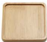
10-3400 竹製コースター スクエア size 9×9×1.1cm

※天然の竹から作られているので、色や模様は1個ずつ異なります。 濃いめの茶、ベージュ系など、ランダムでお届けいたしますので、ご了承ください。節などは天然の風合いとしてお楽しみください。