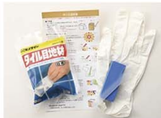
ガラスモザイクアート工具セット 10-2983

モザイクアートに最適なタイル目地材と扱いやすい専用のヘラ、仕上げに便利な専用のスポンジ、ゴム手袋がセットになっています。作り方の説明書付きで初心者さんでも安心です。