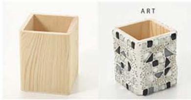
10-2987 ウッドベース 四角 size 縦：8cm×横：8cm×高さ：10cm

平面ケースは配置がしやすく、ペンたてなどに便利なサイズです。壺型はインテリアのポイントに。 ※耐水性ニスを塗ってからご利用ください