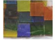
クリアカラー MIX 10-2961 約50g入り